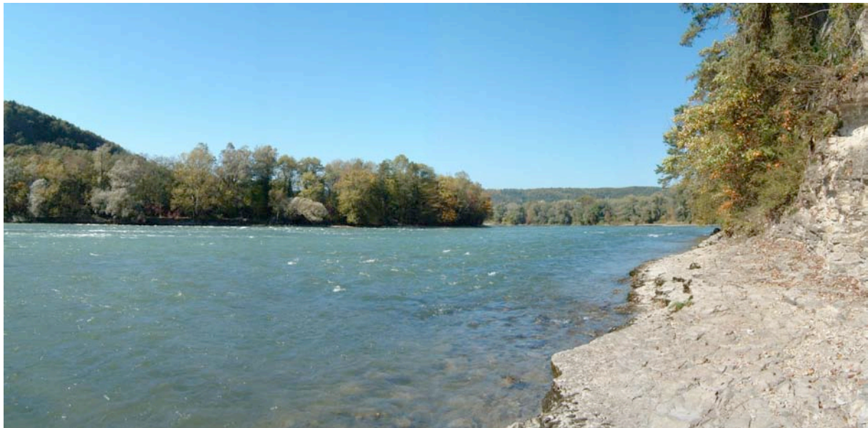
Foto: Teil der Rheinstrecke oberhalb Waldshut-Tiengen (15. Oktober 2003; ca. 370 m 3 /s)

Insgesamt müssen wir nach allen unseren Studien annehmen, dass der fischökologisch optimale Sockelabfluss im Restrhein bei ca. 100 m 3 /s liegt. Ein Abfluss von ca. 80 m 3 /s kann - bei Integration der terrestrischen und semiaquatischen Gesichtspunkte - als gesamtökologische Optimierung angesehen werden. Mindestabflüsse unter 60 m 3 /s sind deutlich zu gering und fischökologisch nicht vertretbar.